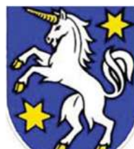
Opatovce nad Nitrou