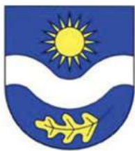
Planá nad Lužnicí